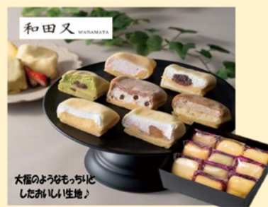
B328 和田又 7種の手包もちもっちりクレープ10個 3,564円(税込)