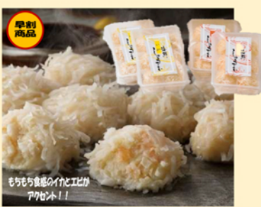
B117 福岡 志岐蒲鉾本店 海鮮しゅうまい 早割5%off 4,053円(税込)