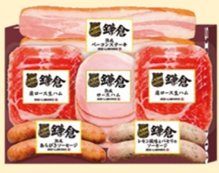
B221 グリル&オードブル詰合せ 4,320円(税込)

その他おすすめ商品を多数掲載したカタログがございます。 カタログをお持ちいたしますのでお気軽にご連絡ください。