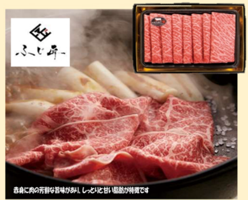
B151 厳選肉専門店 ふじ匠 やまぐち和牛焼き焼き用 10,800円(税込)