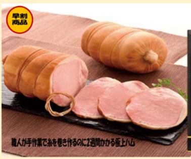
B108 伝統の布巻きロースハム 早割5%off 6,156円(税込)