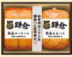
B220 熟成ロースハム熟成ももハム2本詰め 5,400円(税込)