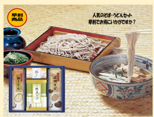
B123 信州そば・細うどんセット 早割10%off 2,430円(税込)