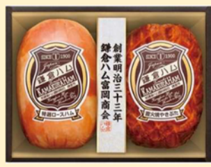
B218 特選ロースハム・直火焼やきぶた2本詰め 3,564円(税込)