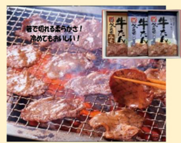
B215 味付け牛タネセット(塩・味噌) 5,400円(税込)