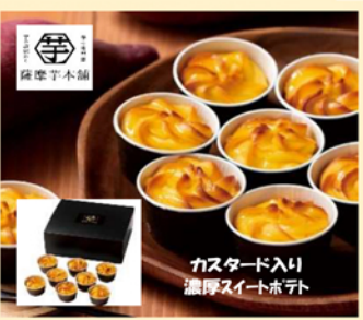
B162 薩摩芋本舗とろける窯焼きスイートポテト 3,888円(税込)