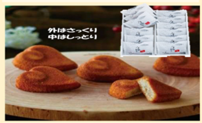
B329 八重雲晴れて7ヶツヅエ12個入 3,200円(税込)