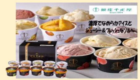
B381 銀座千疋屋銀座プレミアムアイス&ソルベ 5,400円(税込)